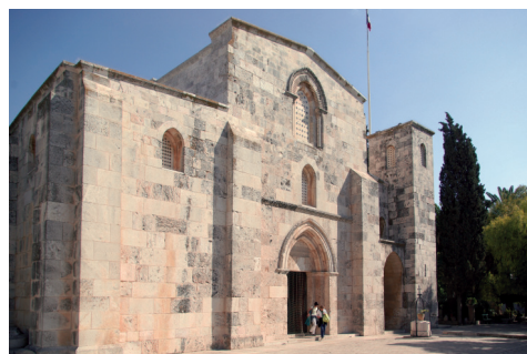
Szt. Anna templom Jerusalemben