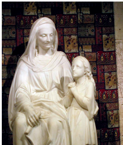
Mária az édesanyjával (Szt. Anna templom)

Jézus mennybemenetelének ünnepe a Húsvét utáni 40. nap, és 10 nappal előzi meg Pütkösöt a Szentlélek kitöltésének ünnepe. Sajnálatos, hogy a keleti-és a nyugati keresztyénség – néhány méter különbséggel ugyan, de – két különböző helyen ünnepli Jézus mennybemenetelét. Az orosz orthodox kolostor 60 méter magas különálló harangtornya az egyik jel erre. Nagyszerű olyan súlyos, hogy Jaffa kikötőjéből orosz zarándokok ezrei vontatták a helyszínre. A nyugati keresztyének, így mi is, az Olajfák hegyének legmagasabb csúcsán álló ponthoz, az Ascensio-kápolnához zarándokoltunk el. A kápolna magántulajdonú területen áll, és egy évben csak egyszer en-