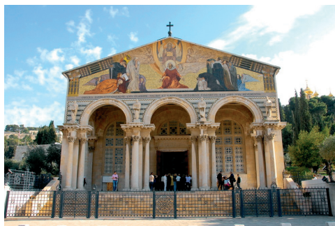
Szűz Mária Sírjának temploma