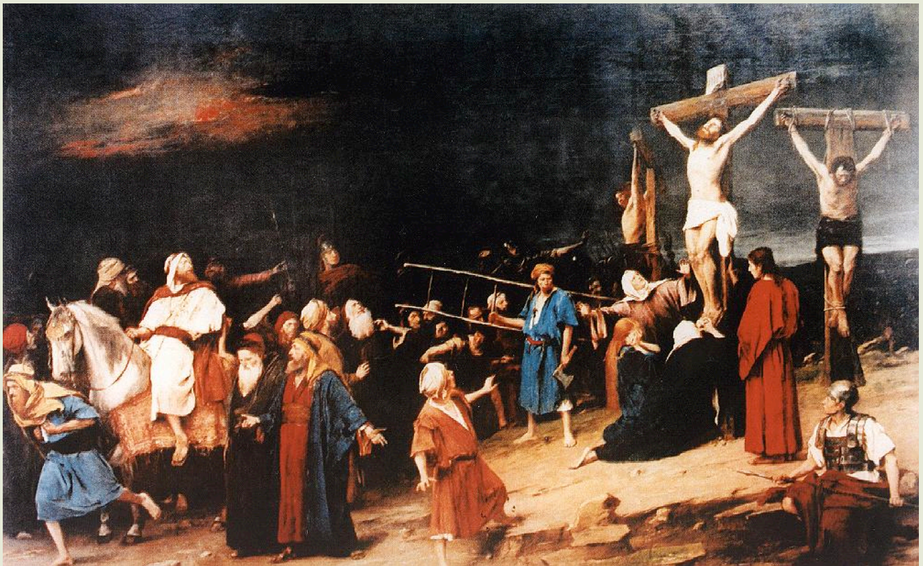
Munkácsy Mihály: Golgota