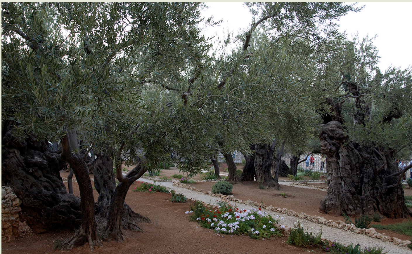
Jeruzsálem Gecsemáné kert