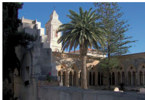
Jeruzsálem Mi Atyánk temploma

Az olajfák hegye jelentős hely mind az Ő- mind az Újszövetség népe számára. Az Ószövetség korában az engesztelés napján itt égették el a vörös tehenet, áldozatul Izrael bűneiért. Egy tiszta ember szedje össze a tehen hamvát, helyezze el a táboron kívül egy tiszta helyre, és legyen az Izráel fiai közösségéé, hogy vétektől megtisztító vizet készítsenek vele. (4Mózes 19:9)