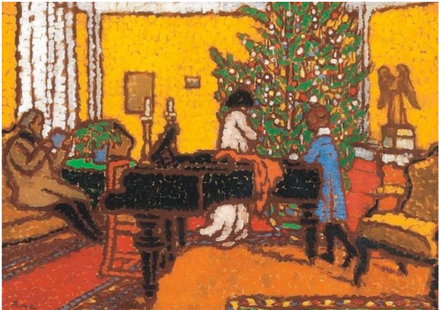
Rippl-Rónai József Karácsony