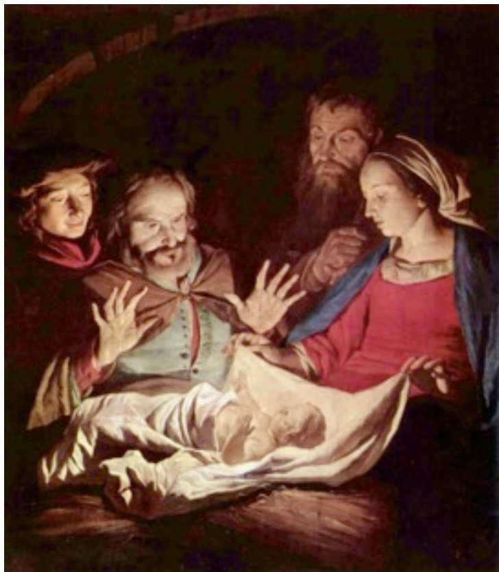
Gerard van Honthorst: A pásztorok imádása 1622

Kívánom, hogy mindenki tegyen egy lépést ezen az úton nem valakivel szemben, hanem valakiért! Istentől áldott ünnepet kívánok mindenkinek!