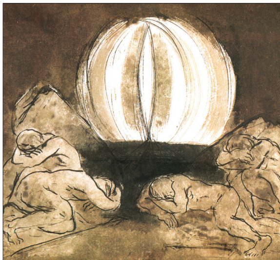
Borsos Miklós: Feltámadás (részlet, 1975)