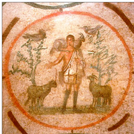
Priscilla katakombái, Róma, Olaszország

lunk is beszél, nem csak magáról: „melyik ember az közületek, aki...?”. Azaz: Jézus a mi viselkedésünkre mutat és kérdez rá. Nem úgy vezeti be, hogy a jó Pásztorról akar beszélni (ezt megteszi János evangéliumában). Ő most minket kérdez, és rólunk kérdez. A másokért való személyes felelősségünkről beszél, azt célozza meg, és arra kérdez rá. Isten ugyanis bizonyos mértékben minden hívőre, azaz ránk is bízta a hitben járó testvéreket és a tévelygő ismerősöket, barátokat, családtagokat, munkatársakat... Felelősek vagyunk azokért, akiket Isten életünk részévé tett. Sajnos azonban hajlamosak vagyunk elfelejteni, hogy Isten az elveszett embereket is ránk bízta, azokat, akik még nem hisznek Istenben jelenleg. Nem fogadjuk el,