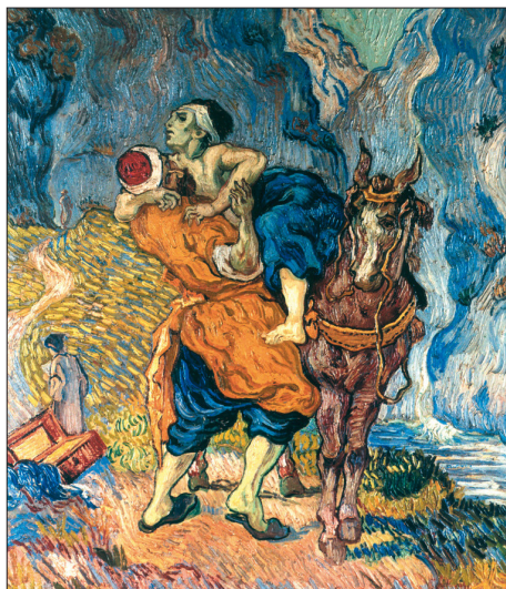
Van Gogh: az irgalmas samaritánus (Delacroix nyomán)

Mennyi példa, mennyire különbözőek a szereplők! Akár mai is lehetne ez a